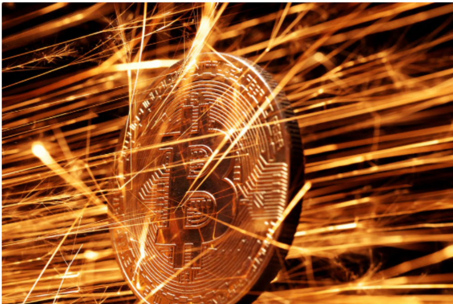
Las declaraciones del presidente electo sobre una reserva estratégica de Bitcoin reforzaron el optimismo de los inversores