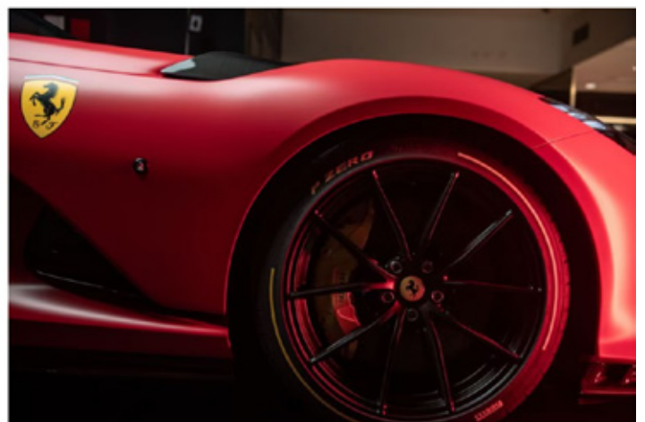
Desde ahora Ferrari acepta criptomonedas como medio de pago

Lorena Gallardo Gil 17 OCT 2023 05:50 PM Tiempo de lectura: 3 minutos